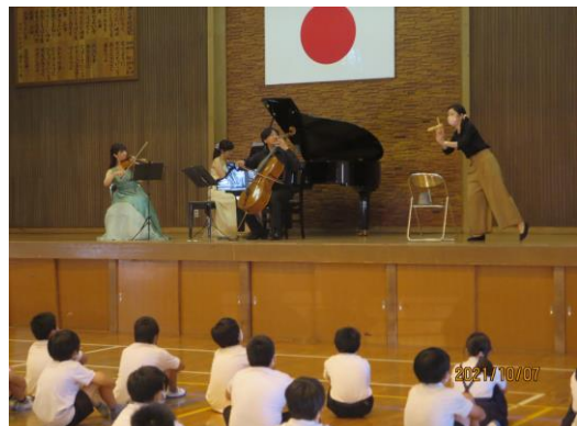
<音色の美しさに聴き入る子ども達>

演奏していただいたのは、「アンサンブル フューシャ」の皆さんです。高学年の部では、チェロ、ピアノ、バイオリンで奏でるモーツァルトやブラームスの曲に聴き入る子ども達の姿が印象的でした。また、サンサーズの「白鳥」や、ホルストの「木星」など教科書で学んだ楽曲にうっとり聴き入る子どももいました。最後に、「もみじ」や「ふるさと」など日本の秋の楽曲を含め、全11曲の演奏に感動しました。楽器の詳しい説明や本校の先生も加わった演奏に、音楽の楽しさも感じたことでしょう。「アンサンブル フューシャ」の皆さん、ありがとうございました。