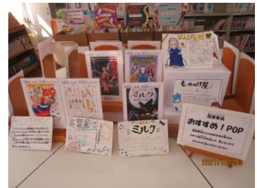
<図書委員が作ったPOP>

図書委員が作ってくれた、おすすめ本の紹介カード・POPは、図書館内に飾っています。とても上手で、素敵な作品です。お薦めの本と一緒に飾ってありますので、POPを見て、面