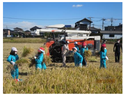
<コンバインを使って>