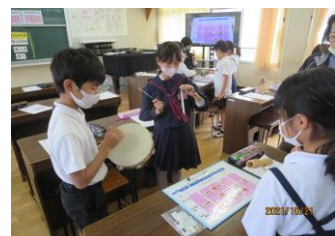
<図書委員が作ったPOP>

例えば、中学年では、音の響きを感じとれるように、音の組み合わせや重なり、響かせ方の工夫をし、イメージに合う音楽を班で協働しながら創る授業に取り組んでいます。音楽や友達との対話活動を通し、音楽の楽しさを味わっています。音楽を楽しむ子どもを求め、授業は、続きます。※11月2日予定の筑後地区音楽研究大会は、コロナ禍のため中止となっております。